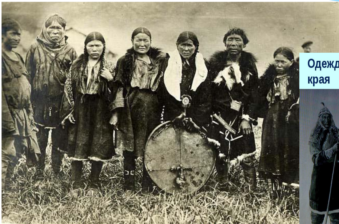
Одежда коренных жителей Приморского края